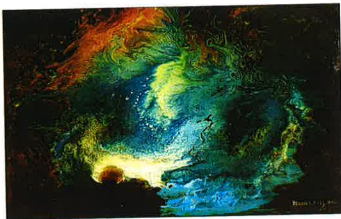
Flammes de mer "Okoumé", laque sur bois, 69 x 59 cm