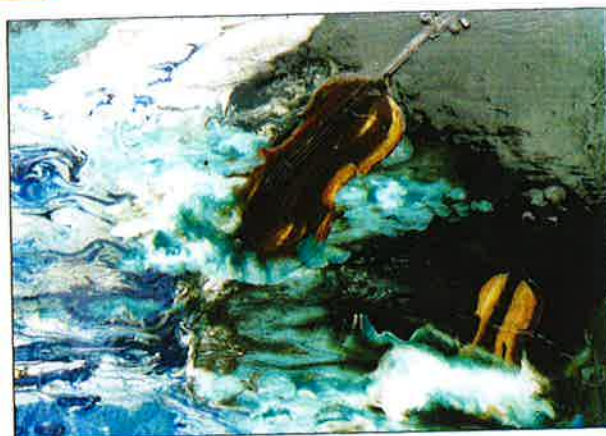
"Duo", laque sur bois