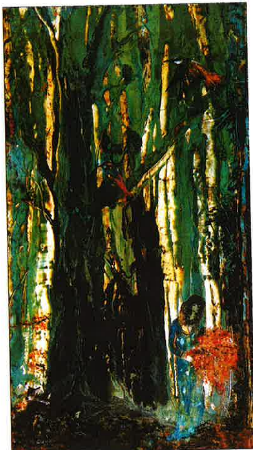
"Mélusine", laque sur bois, 100 x 50 cm

La forêt et ses mystères, la mer et son inlassable mélodie, des thèmes repris par cette artiste, illuminés de son imagination créatrice. Car, rien de moins banal que ces laques travaillées admirablement et avec passion, d'une richesse superbe tant dans la palette travaillée, nuancée, aux harmonies subtiles que du monde foisonnant et féérique reconstitué par le peintre. Chaque composition est une forme de poème, une ode à la nature dans ses divers aspects. Avec intelligence et maîtrise, Christiane Meunier-Clisson se dégage de la stricte réalité pour aller à l'essentiel dans une atmosphère poétique, parfois mystérieuse qui incite soit à la rêverie, soit à pénétrer dans ses paysages. Les observant attentivement, se découvrent un long et patient travail de la laque sur okoumé, une alchimie personnelle de l'artiste qui, depuis 30 ans, pratique cette technique et les innombrables personnages en filigrane peuplant l'espace. Musicienne autant que peintre, elle crée des oeuvres lumineuses où matière dense et transparences